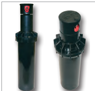
RAIN S 050